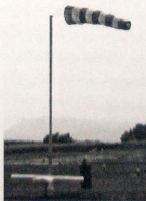
MODELO DE POSTES DEMARCADORES DE RADIOS Y VIENTOS